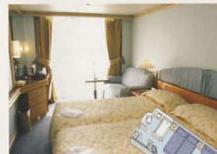
D E パルコニー