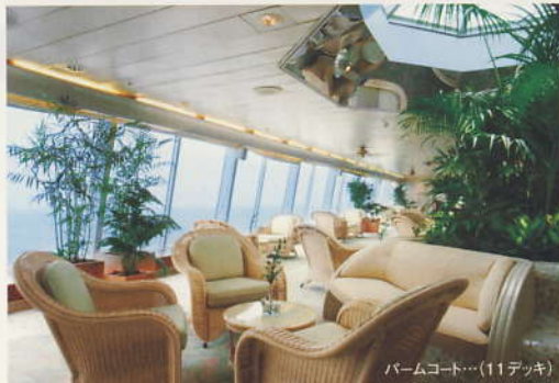
バームコート... (11デッキ)