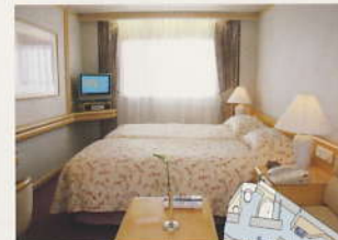
F K ステート