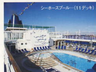
シーホースプール... (11デッキ)

シックなシガーバーや、 ビスタラウンジをはじめ、 くつろげる空間が揃っています。