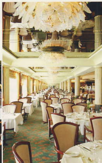
フォーシーズン・ダイニングルーム... (5デッキ)