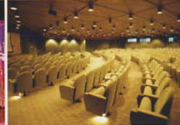
ハリウッドシアター... (6デッキ)