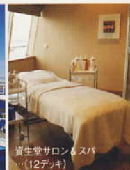
資生堂サロン&スパ ... (12デッキ)