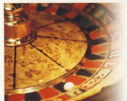
モンテカルロ(イメージ)

モンテカルロやライブラリー、 コンピュータープラザなど、 趣味の時間を過ごせる空間が 多数あります。