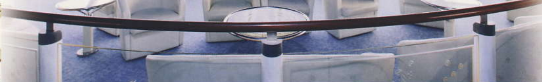
ビスタラウンジ... (11デッキ)