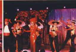
ギャラクシーラウンジ... (6デッキ)