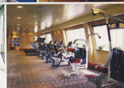
フィットネスセンター... (12デッキ)