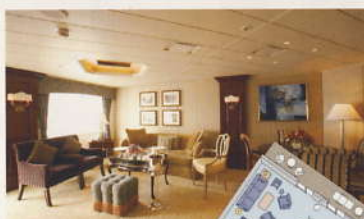
S ロイヤルスイート

※救命ボートや救命いかだ、乗下船用タラップなど、 客船に固有の設備のため、一部の客室およびKステ ートは眺望ができません。※ツインベッドはナイト テーブルをばさんで、離すことも可能です。※面積に はバルコニーが含まれます。