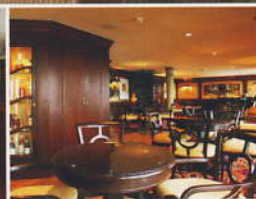
マリナースクラブ... (6デッキ)