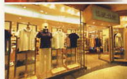
アスカコレクションズ... (6デッキ)