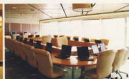
コンピュータープラザ... (11デッキ)