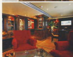
シガーバー... (6デッキ)