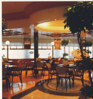
ザ・ビストロ... (6デッキ)