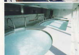
グランドスパ... (12デッキ)